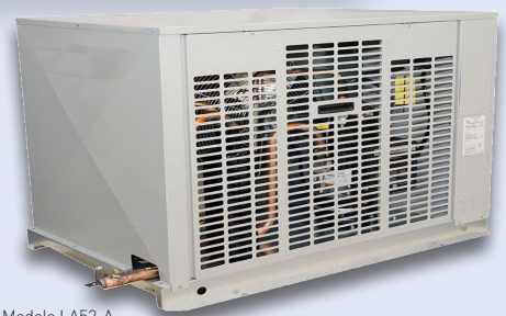
Modelo LA52-A- R404A-1